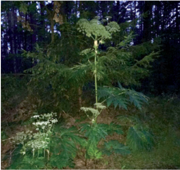
Die blühende Herkulesstaude kurz vor unserer Aktion

Beim Reviergang fiel sie ins Auge: Eine über 2,5 m hohe Staude des Riesenbärenklau. Die auch Herkulesstaude genannte Giftpflanze ist mehr als nur störendes Unkraut, sie ist eine ausgesprochen unangenehme invasive Art, die keinen Platz für andere lässt und schwere Verbrennungen hervorrufen kann.