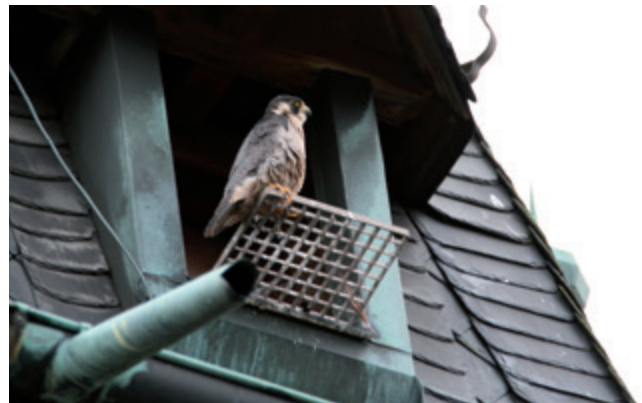
Der Terzel am Nistplatz auf dem Cadolzburger Aussichtsturm

Der bisher von Turmfalken besetzte Nistkasten wurde im Jahr 2015 von Wanderfalken übernommen. Bisher konnte keine Beringung erkannt werden. 2015 flogen 4 Junge aus. Im Jahr 2016 bestand das Gelege aus 6 Eiern. Wir vermuten, das ein anderes Weibchen dazu gelegt hat (Veitsbronn?). Da dieses Gelege zu groß war, wurden die Eier vermutlich beim Wenden immer wieder aus der Nistmulde gerollt und sind erkaltet. Es schlüpfte nur ein junger Falke. 2017 flogen wieder 4 Junge aus.