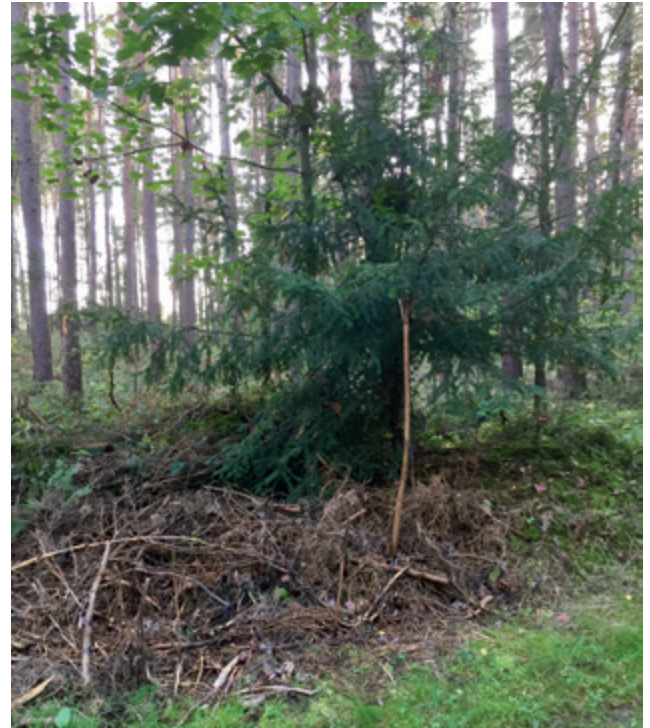
Die Überreste der Pflanze ein viertel Jahr nach der Aktion

Eine weitere Möglichkeit ist, den Boden in 10 bis 15 Zentimeter Tiefe um die Pflanzen herum wegzufräsen oder zu pflügen. Der Vorgang muss wiederholt werden, damit zu Boden fallende Samen nicht keimen können. Auf die Fläche kommt dann