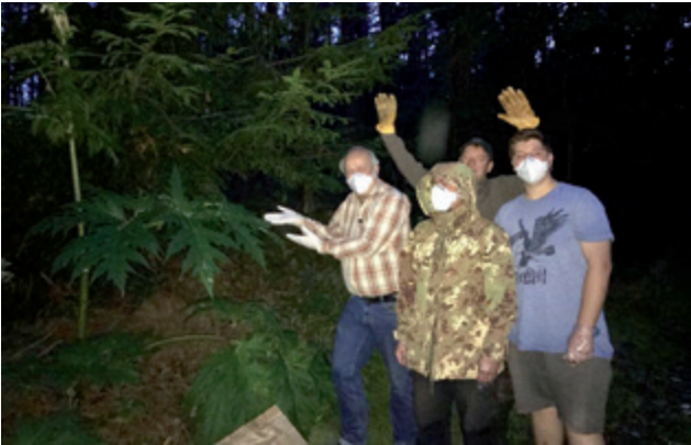
Jungjäger und Revierpächter haben sich zum „Angriff“ gerüstet