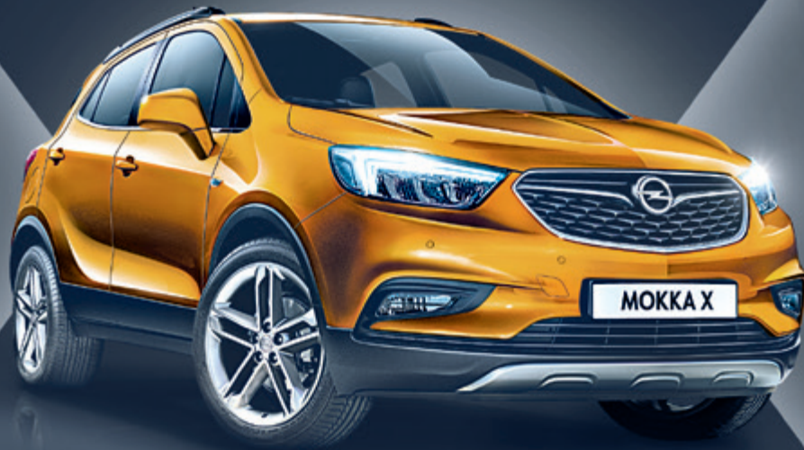
Abb. zeigt Sonderausstattungen.