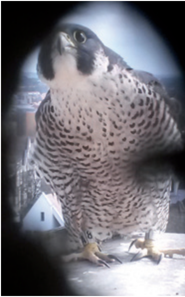
Gut erkennbar am Ring: der Falke PA8 am Faber Schloss in Stein

Im Jahr 2014 erhielt ich die Nachricht, dass im Turm des Schlosses in Stein Wanderfalke nisten würden. Durch einige Beobachtung konnte ich dies bestätigen, hatte jedoch keinen Kontakt zur Verwaltung des Schlosses. Als der Kontakt geknüpft wurde der vorhandene – nicht zu öffnende Nistkasten umgebaut, damit nach der Brutperiode eine Reinigung möglich war. Anhand der Beringung konnte festgestellt werden, dass der weibliche Falke 2012 als Tochter von FZ5 in Schwabach beringt worden war. Im Jahr 2016 konnten zwei Nestlinge bringt werden und 2017 flogen vier Junge aus.