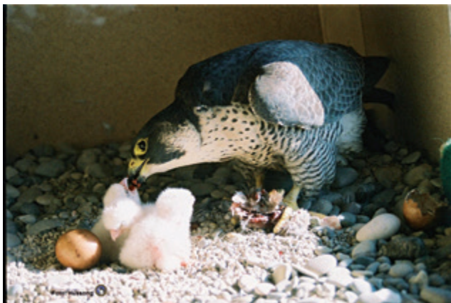
Erste Fütterung der jungen Wanderfalken auf der Kirche St. Paul

Ein Weibchen mit dem Kennring JA0 aus dieser ersten Brut wurde 2010 als Brutvogel in Sachsen bestätigt.